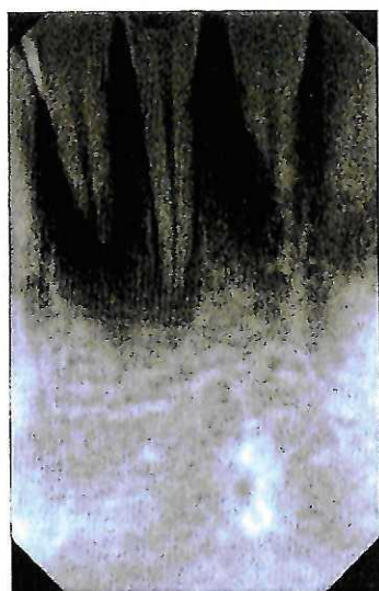
Obr. 4 Resorpce zubů po avulzi dolních řezáků v RTG obrazu a po extrakci zubů 42, 31, 32.