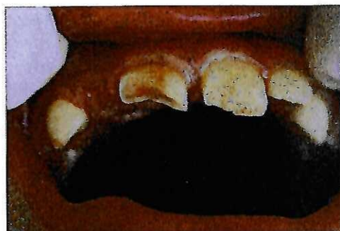
Obr. 3. Zubní pohotovost FN Motol – úraz zubů – subluxace zubu loco 11 s komplikovanou frakturou korunky s otevřením cavum pulpaie loco 11 + luxace zubu 21.

Větší děti přicházejí k ošetření často až s rozsáhlejšími poraněními u více zubů (Tab. 4). Nejčastějším úrazem byla luxace zubu v 36 případech (34%). Na druhém místě byla fraktura korunkové části zubu u 28 pacientů (27%), kde u 12 dětí se jednalo o frakturu korunky komplikovanou. V 6 případech pak došlo ke kombinovanému zranění luxace zubu + fraktura korunky (viz obr. 3).